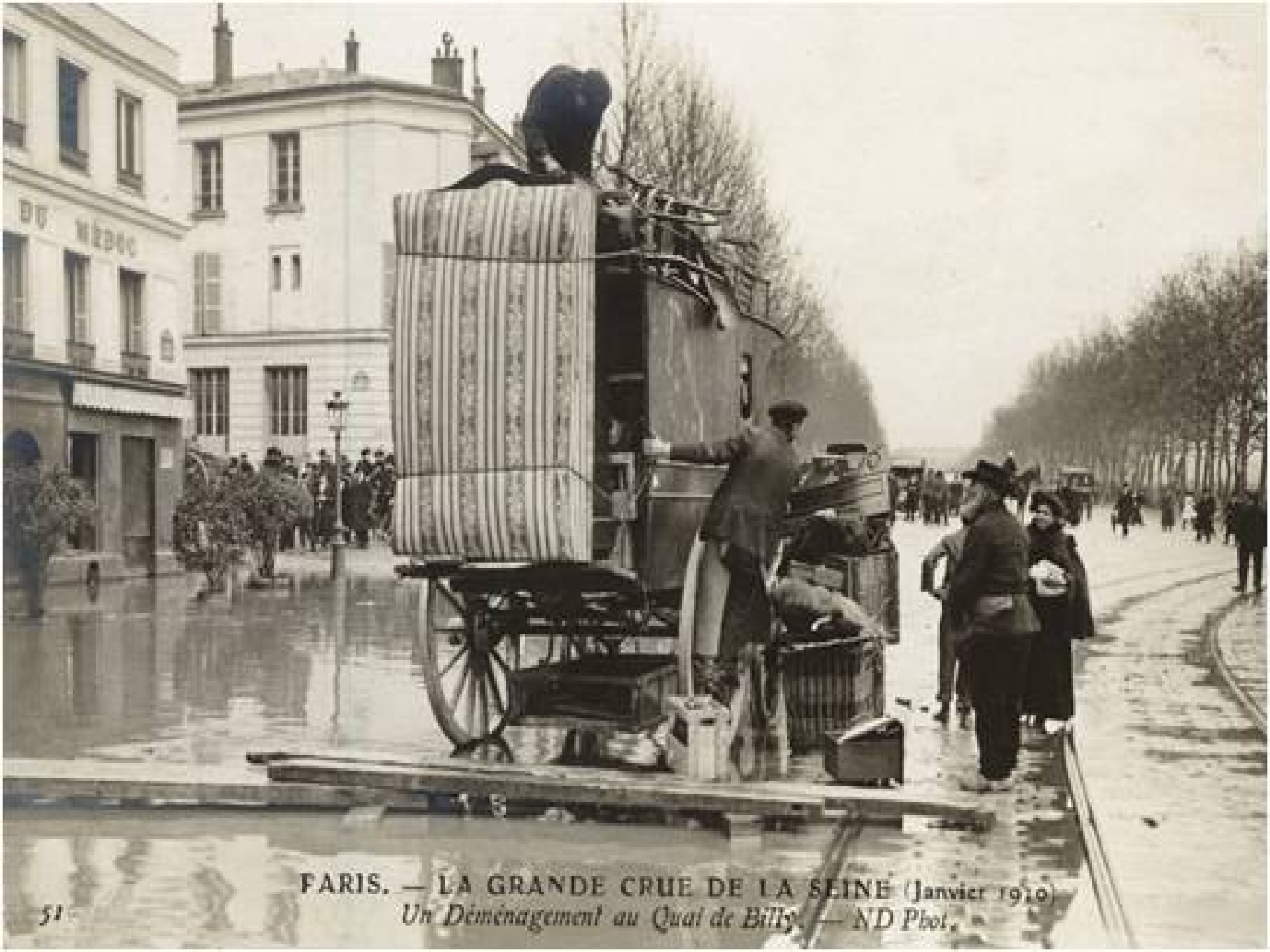
FARIS. — LA GRANDE CRUE DE LA SEINE (Janvier 1910) Un Déménagement au Quai de Billy.