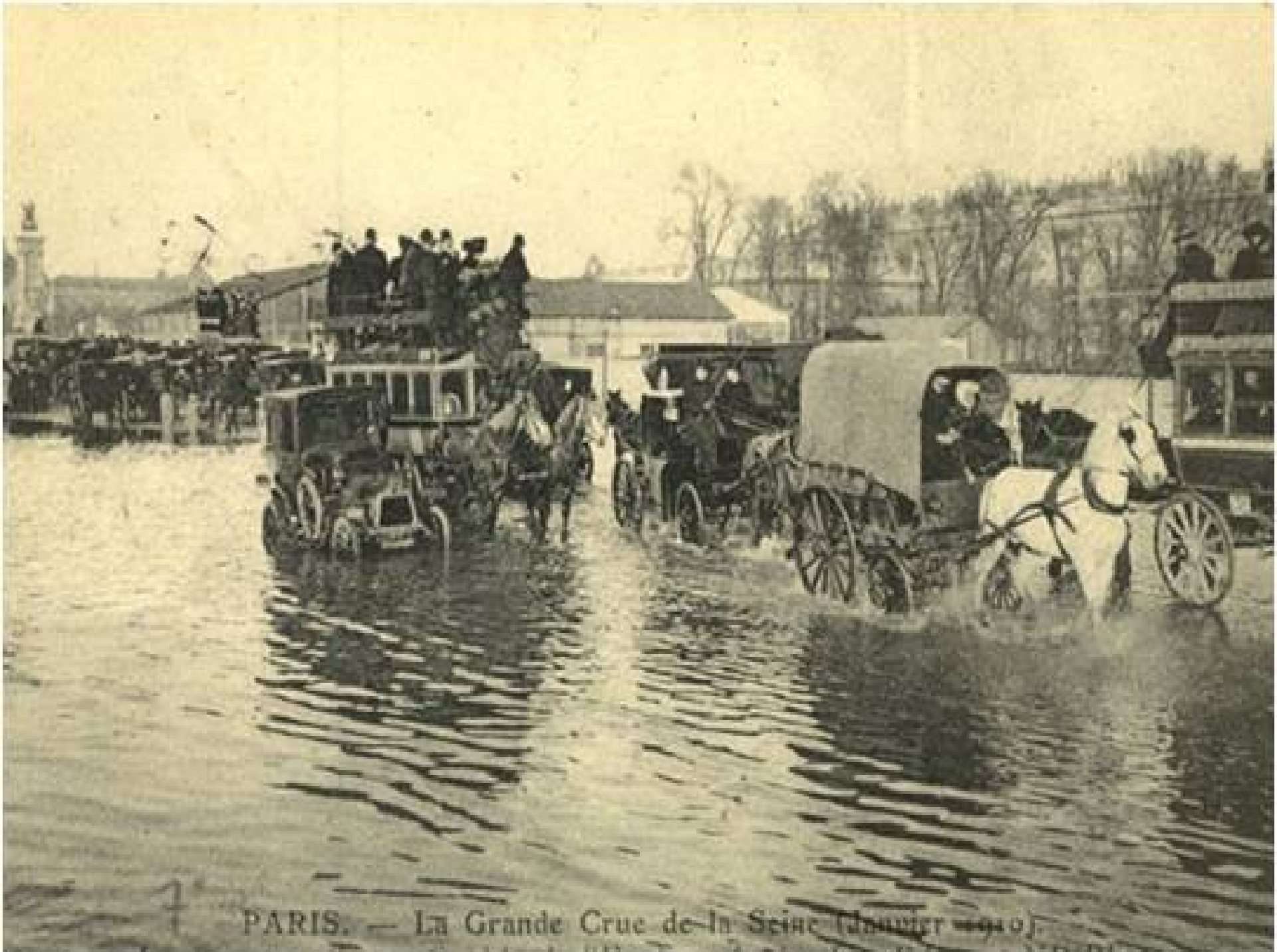
PARIS. — La Grande Crue de la Seine (Janvier 1910).