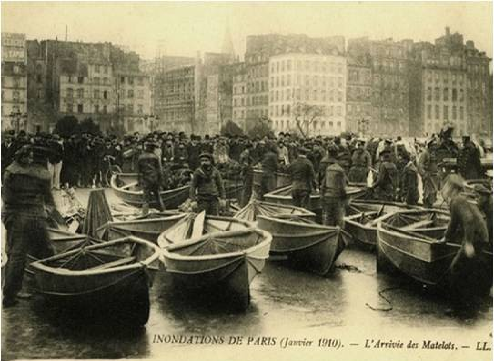
INONDATIONS DE PARIS (Janvier 1910). — L'Arrivée des Matelots.