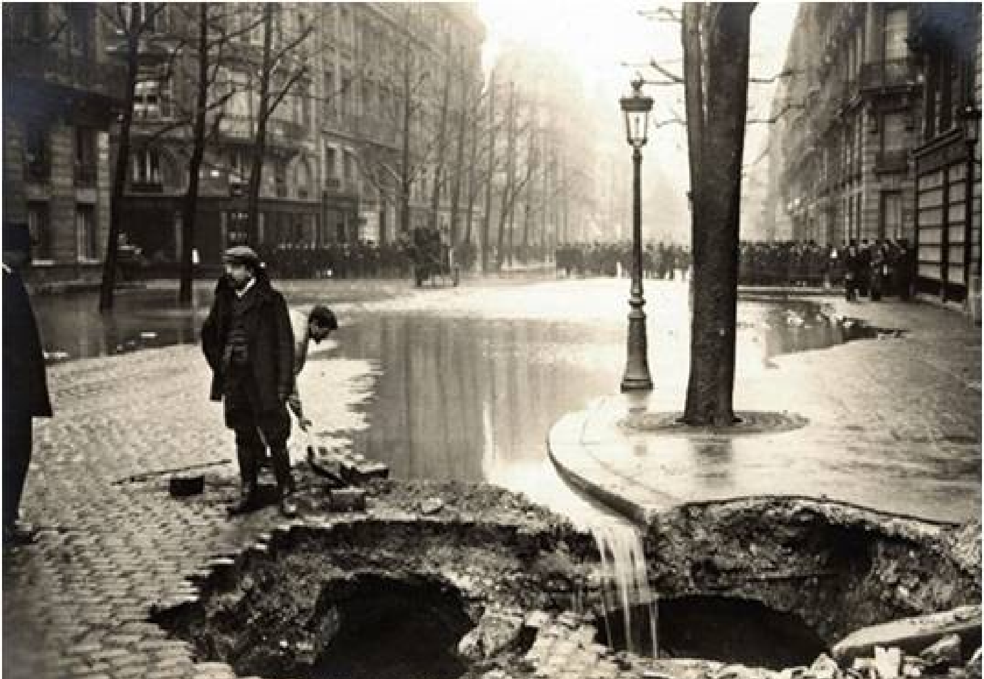
PARIS. — LA GRANDE CRUE DE LA SEINE (Janvier 1910). Effondrement de la voûte d'un égout.