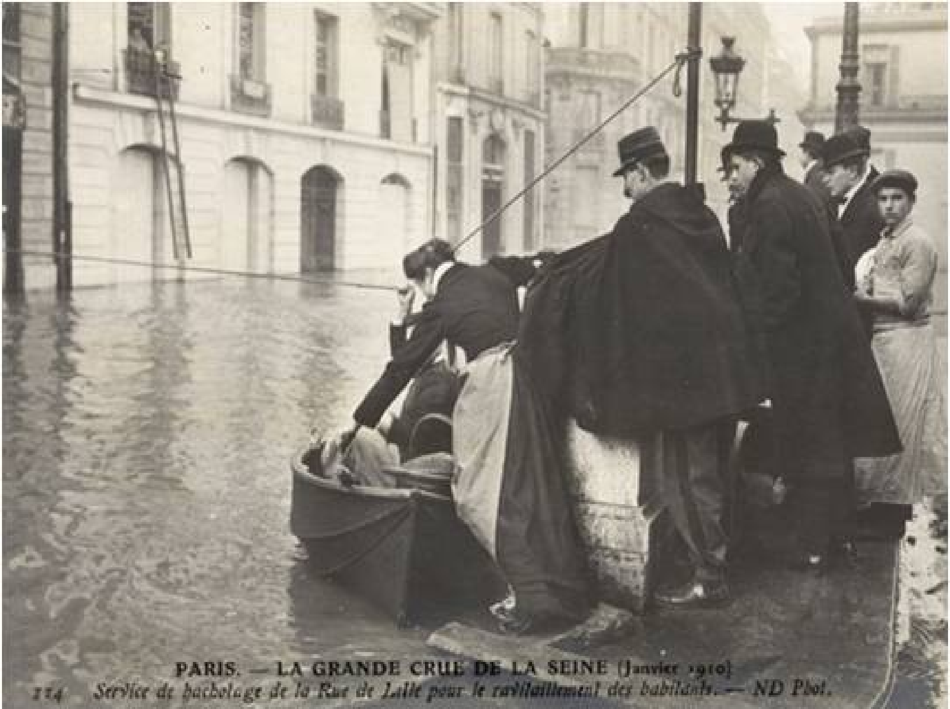
PARIS. — LA GRANDE CRUE DE LA SEINE (Janvier 1910)

114 Service de bacelage de la Rue de Lille pour le ravitaillement des habitants.