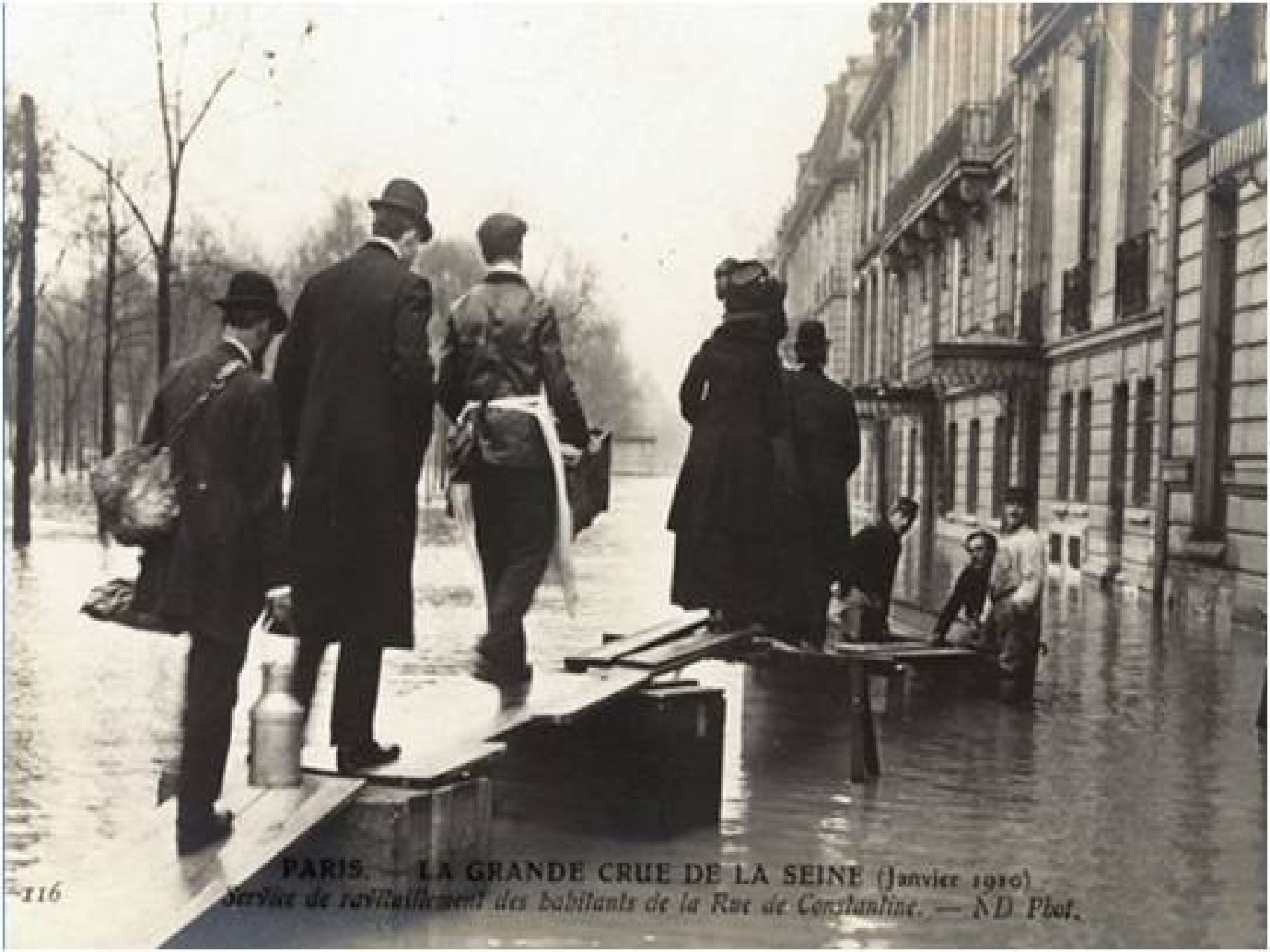
PARIS. — LA GRANDE CRUE DE LA SEINE (Janvier 1910) Série de ravitaillement des habitants de la Rue de Constantin.