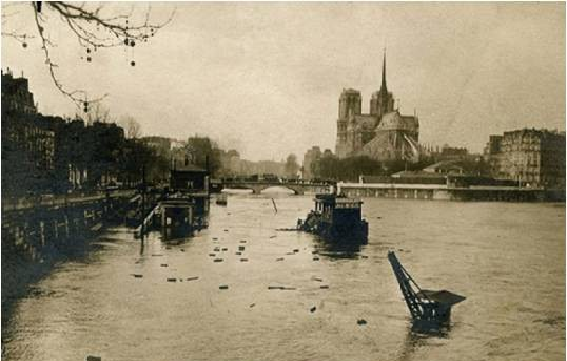
LA GRANDE CRUE DE LA SEINE (Janvier 1910) Le Port de la Tournelle.