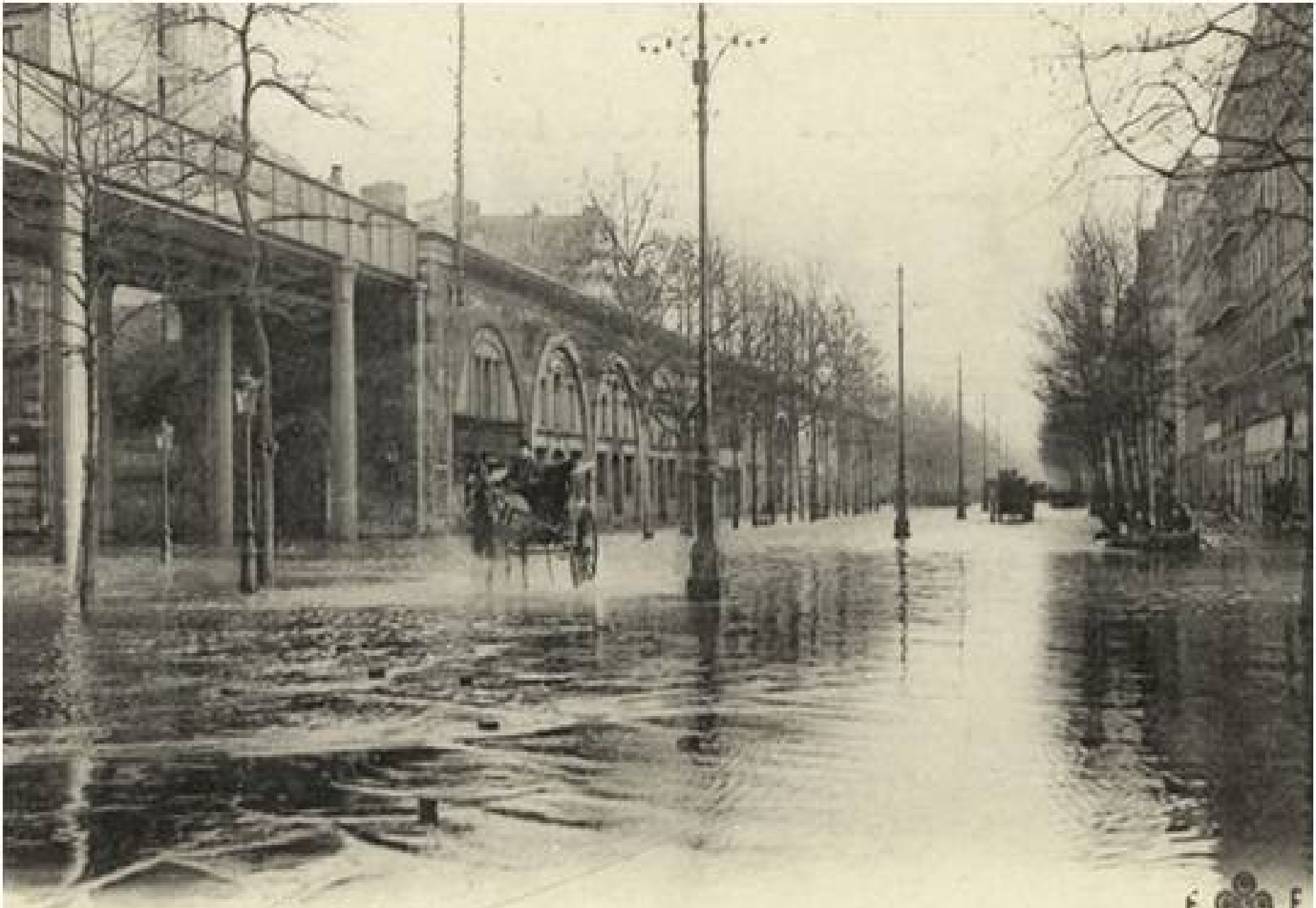
133 Paris-Venise — Inondations 1910 — Avenue Daumesnil