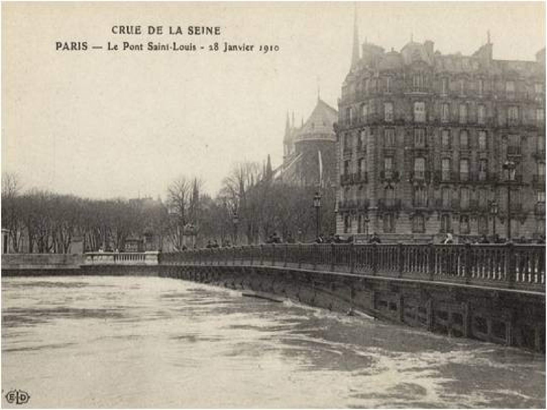
CRUE DE LA SEINE PARIS — Le Pont Saint-Louis - 18 Janvier 1910