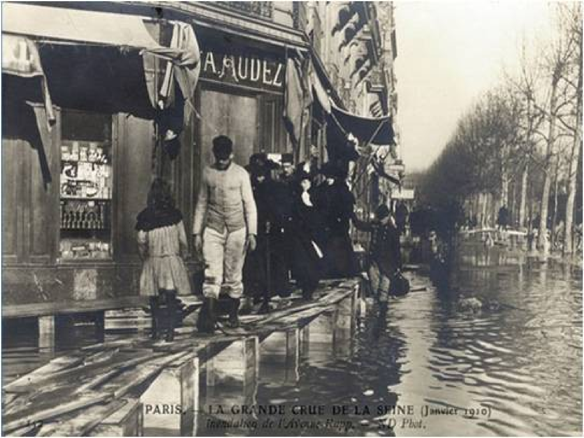
PARIS. — LA GRANDE CRUE DE LA SEINE (Janvier 1910) Illustration de L'Éclair. — S. D. Phot.