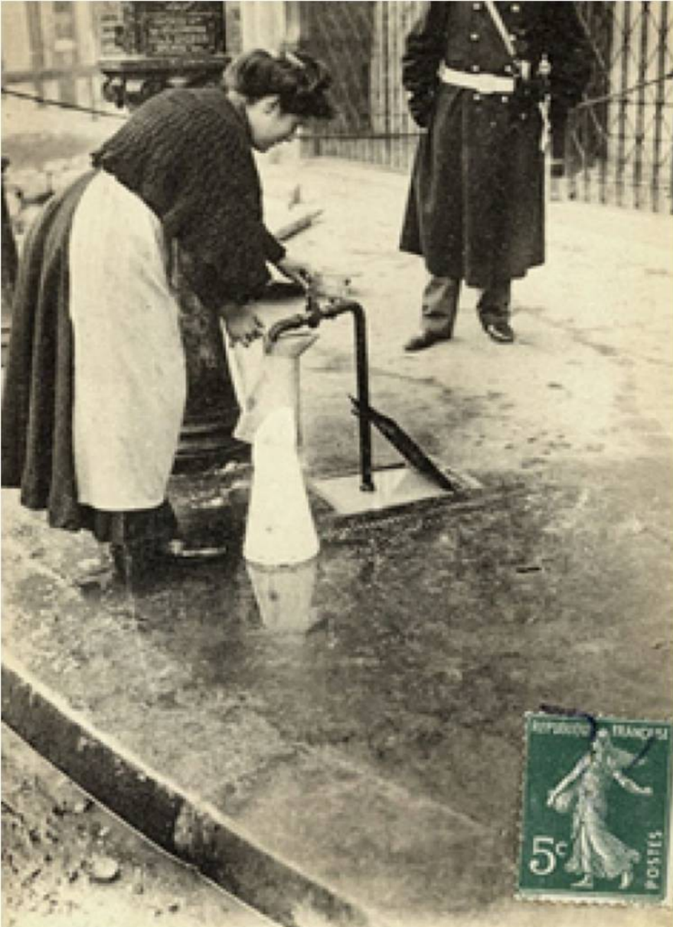
La Crue de la Seine (Janvier-Février 1910) Dans la Rue Royale, un des Quartiers les plus aristocratiques de Paris, on prend l'eau potable sur le trottoir