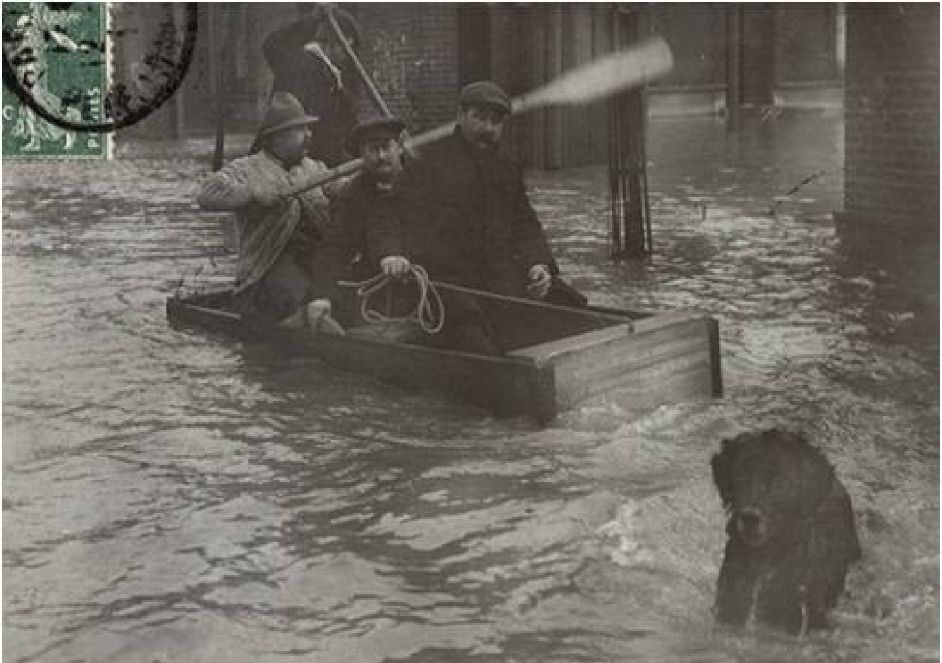
488 Paris. - Inondation 1910- Traversée du Quai de Passy