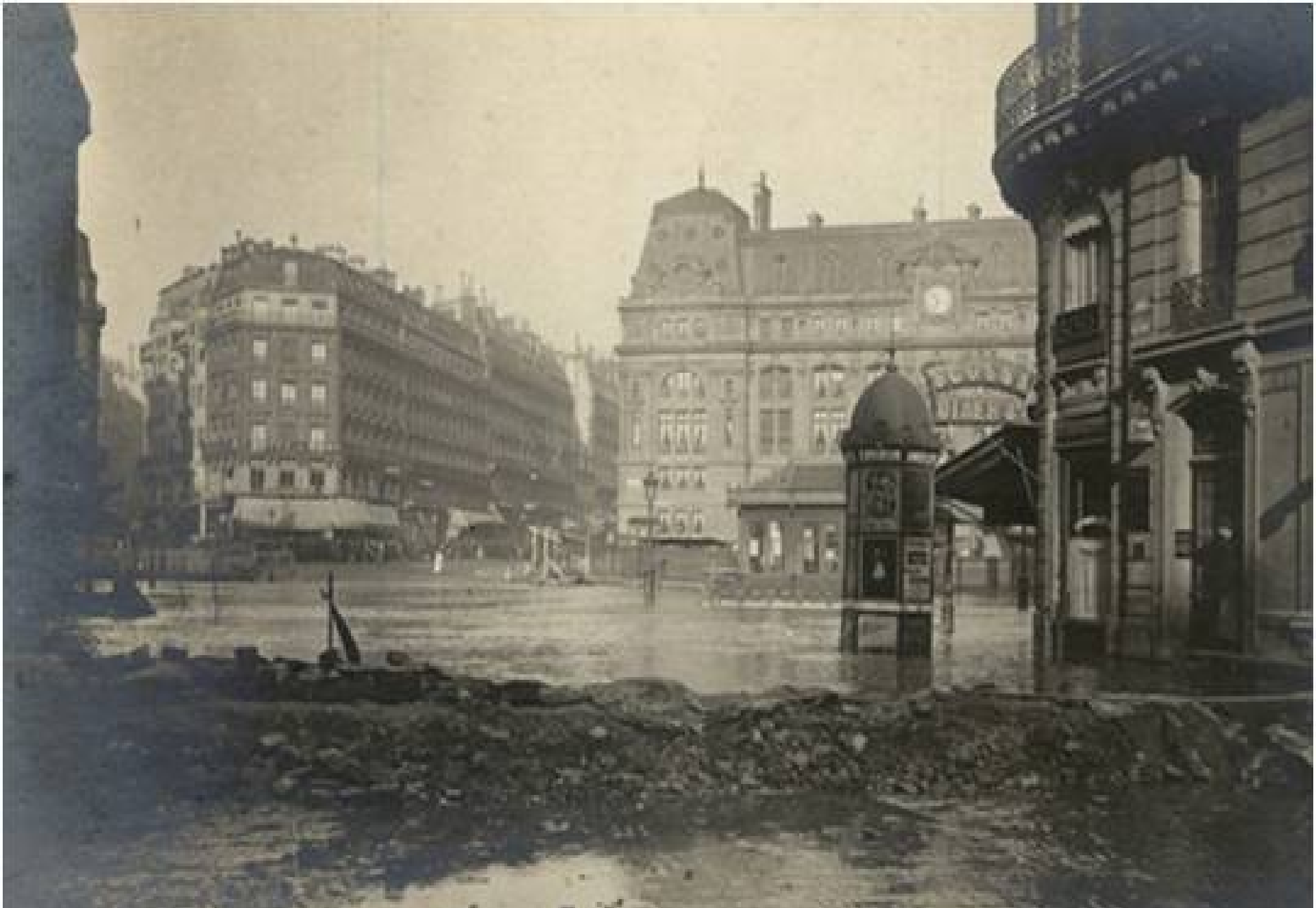
PARIS. — LA GRANDE CRUE DE LA SEINE (Janvier 1910)

160 Barrage établi Rue de l'Arcade contre l'inondation de la Rue Saint-Lazare. — A. Blet