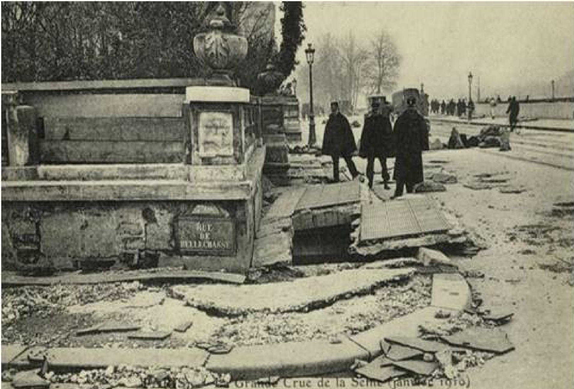
184. La Grande Crue de la Seine (janvier 1910) 184. Dallera de verre soulevées par la pression intérieure de l'eau remplissant la gare d'Orsay c'est par ces ouvertures que se produisait l'inondation de la rue de Lille.