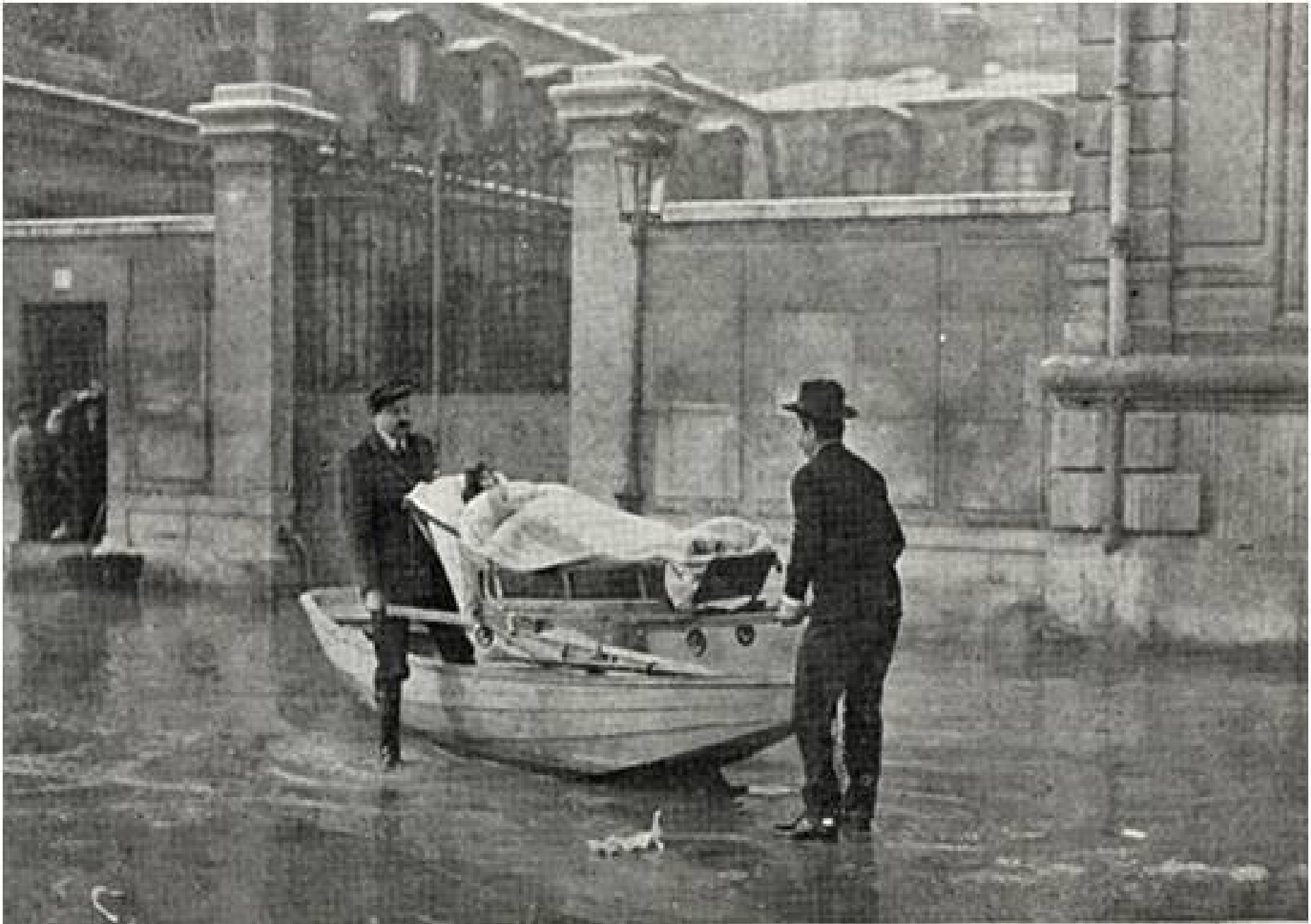
Inondations de Paris (Janvier 1910). Quai de Passy. Sauvetage d'une femme paralytique