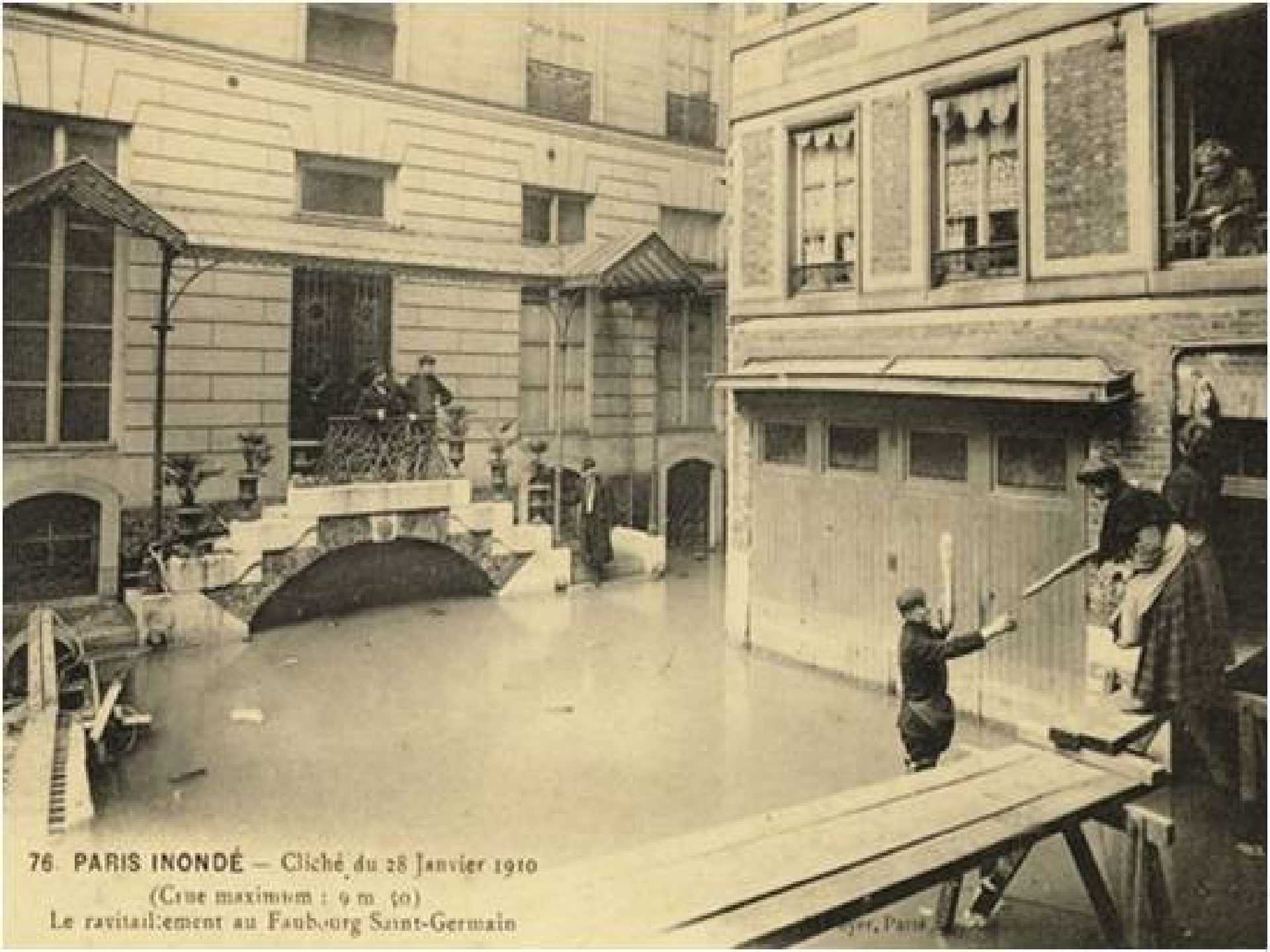
76. PARIS INONDÉ — Cliché du 28 Janvier 1910 (Crue maximum : 9 m. 50) Le ravitaillement au Faubourg Saint-Germain