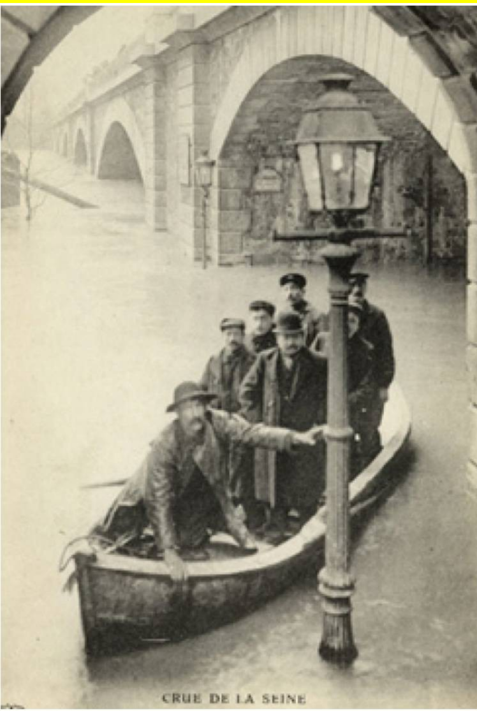
CRUE DE LA SEINE