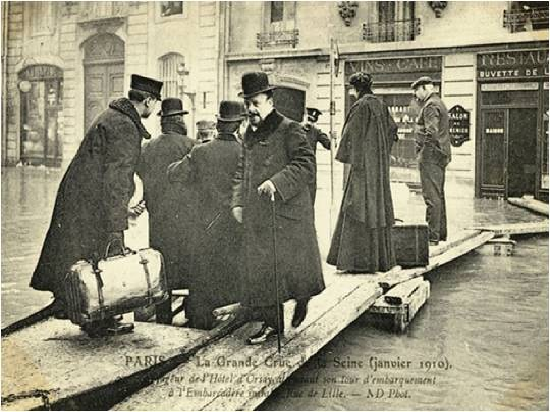
PARIS — La Grande Grue de la Seine (janvier 1910). Le directeur de l'Hotel d'Orsay, M. ... son tour d'embarquement à l'Embarcadere ... de Lille.