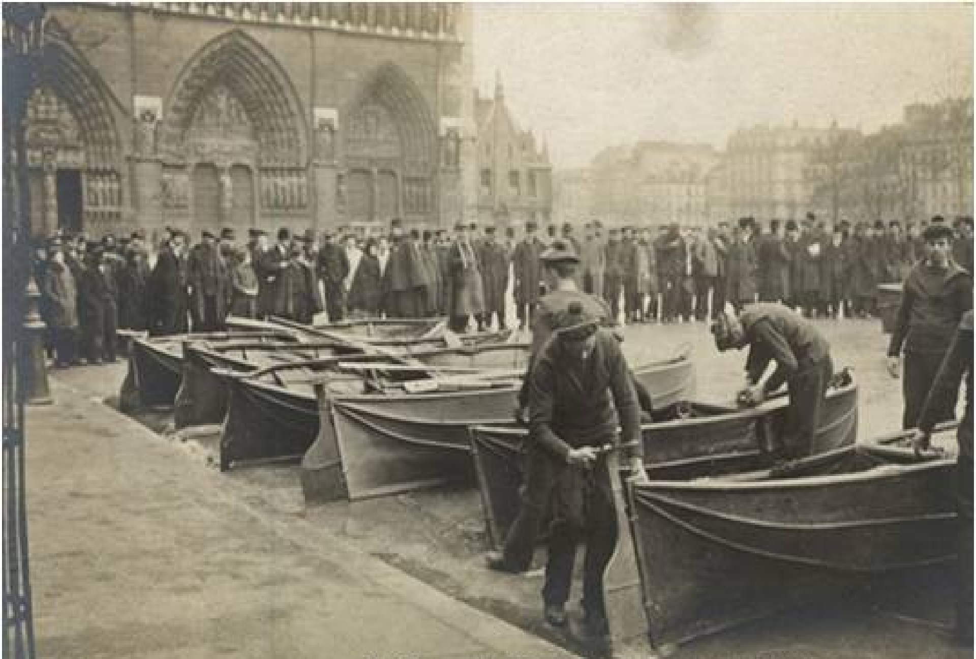
PARIS. — LA GRANDE CRUE DE LA SEINE (Janvier 1910)