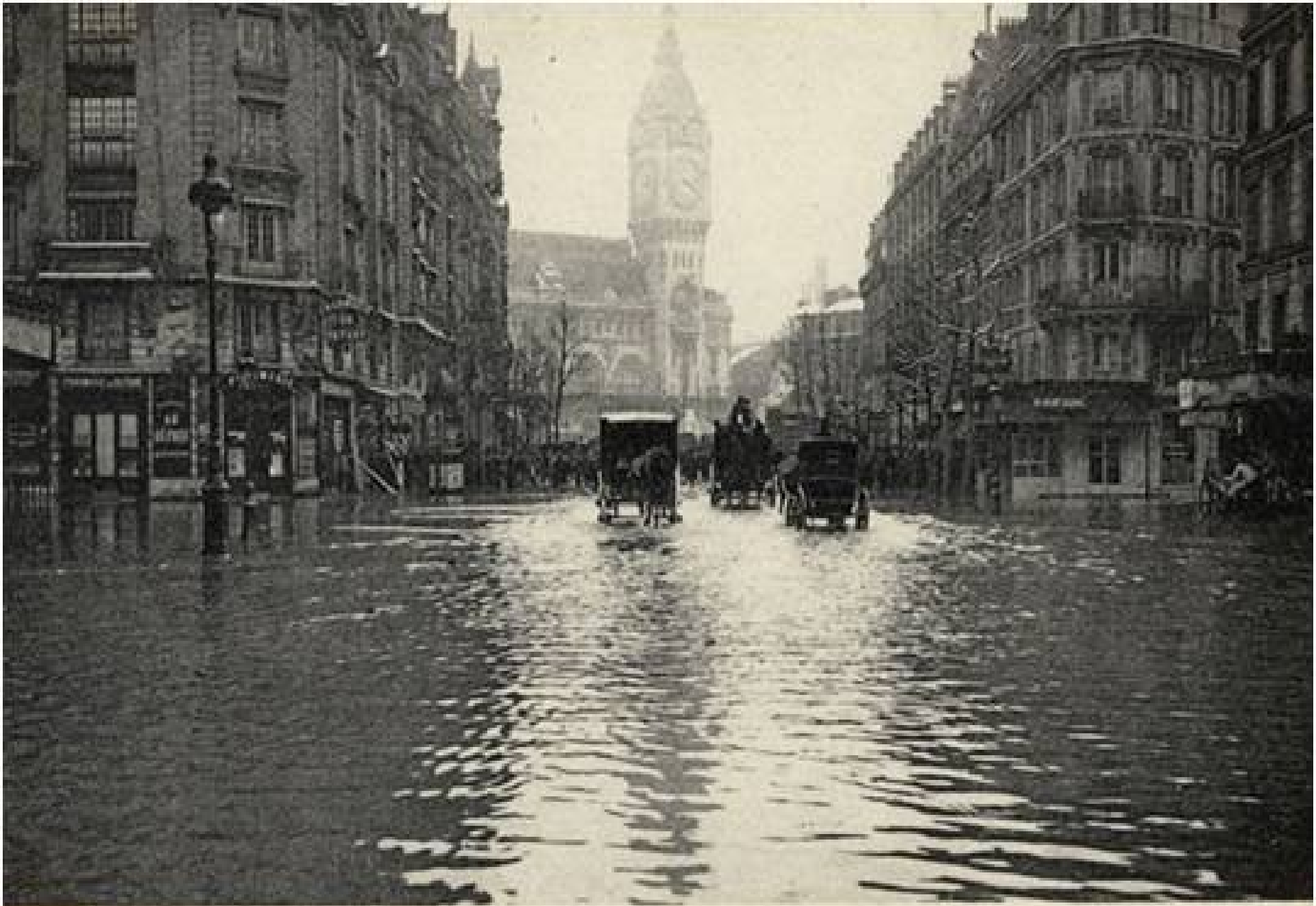
PARIS. — La Grande Crue de la Seine (janvier 1910).

8 Inondation de la rue de Lyon.