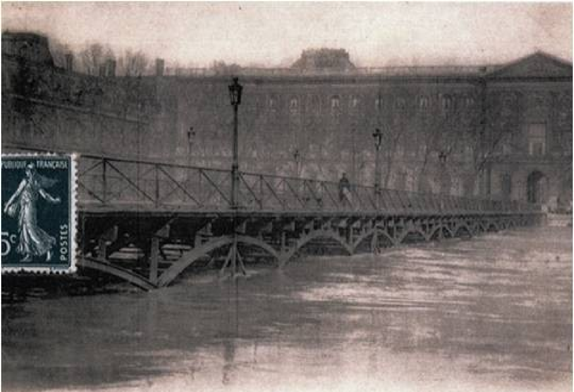
62 INONDATIONS DE PARIS (Janvier 1910). — Le Pont des Arts. — LL.