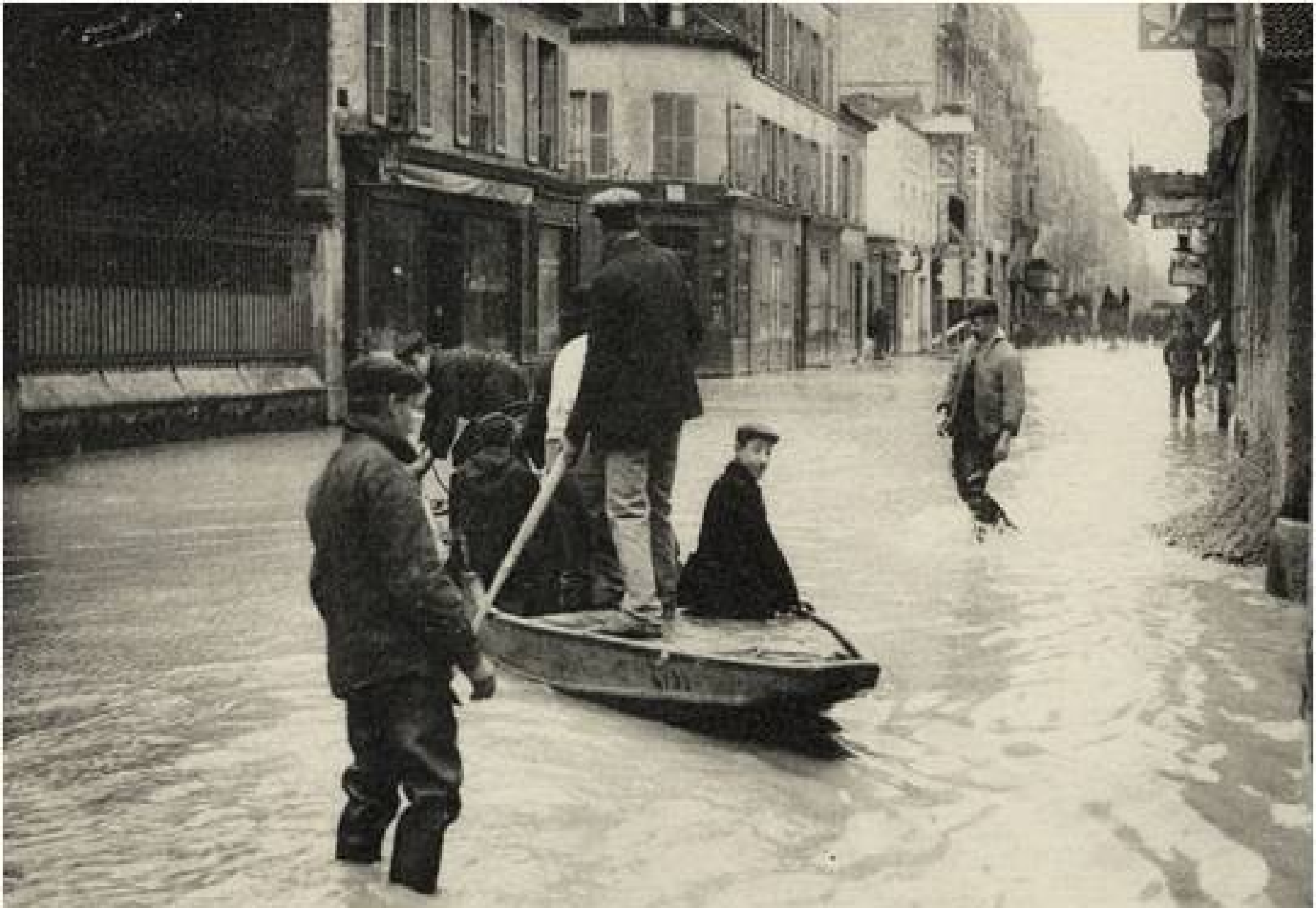
CRUE DE LA SEINE PARIS - Passage des habitants à Javel