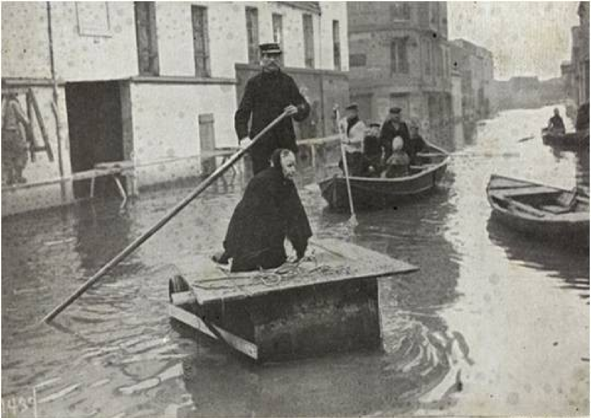
PARIS INONDÉ (Janvier 1910). — Rue de Javel (Grenelle).