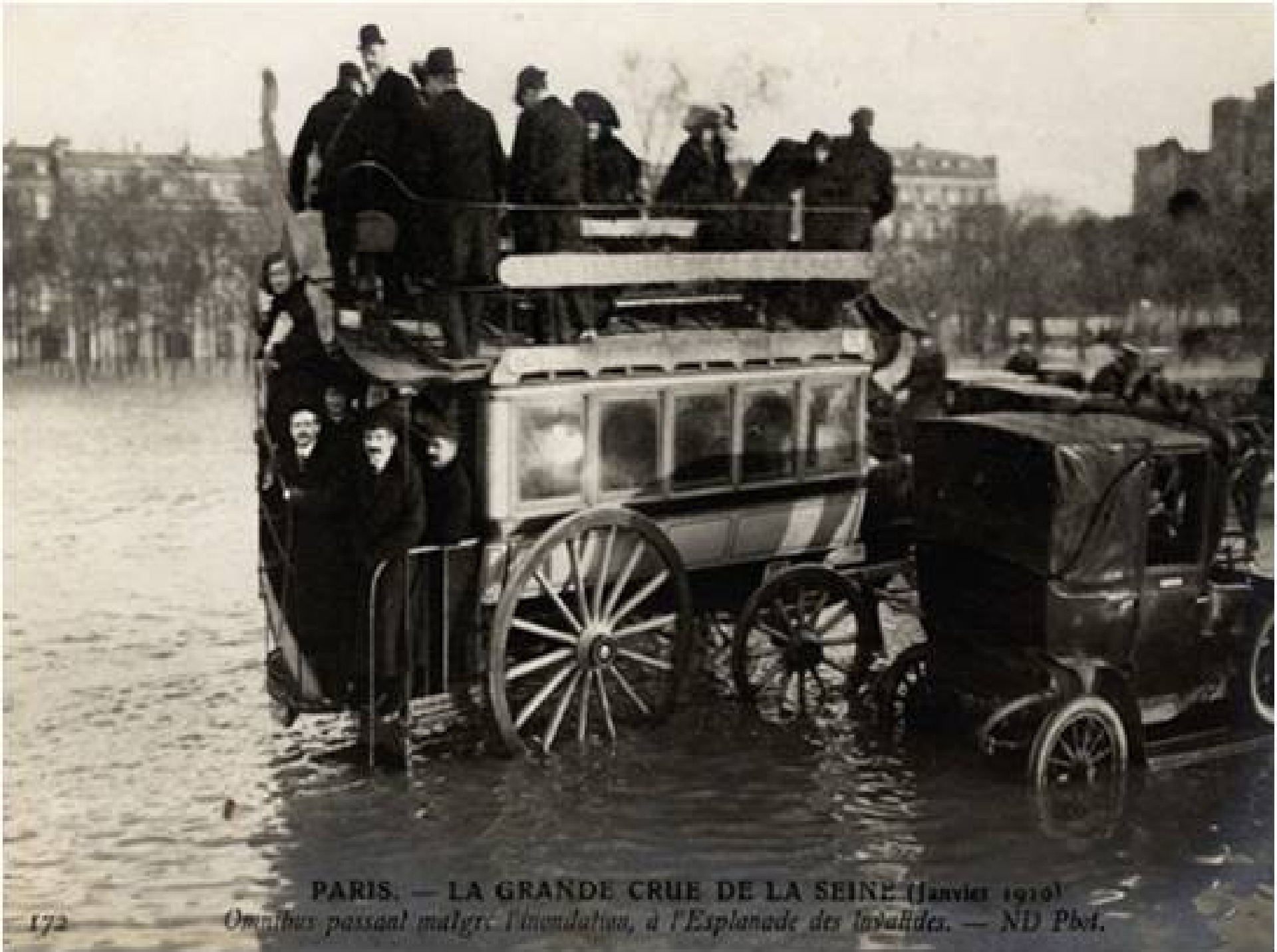
PARIS. — LA GRANDE CRUE DE LA SEINE (Janvier 1910)