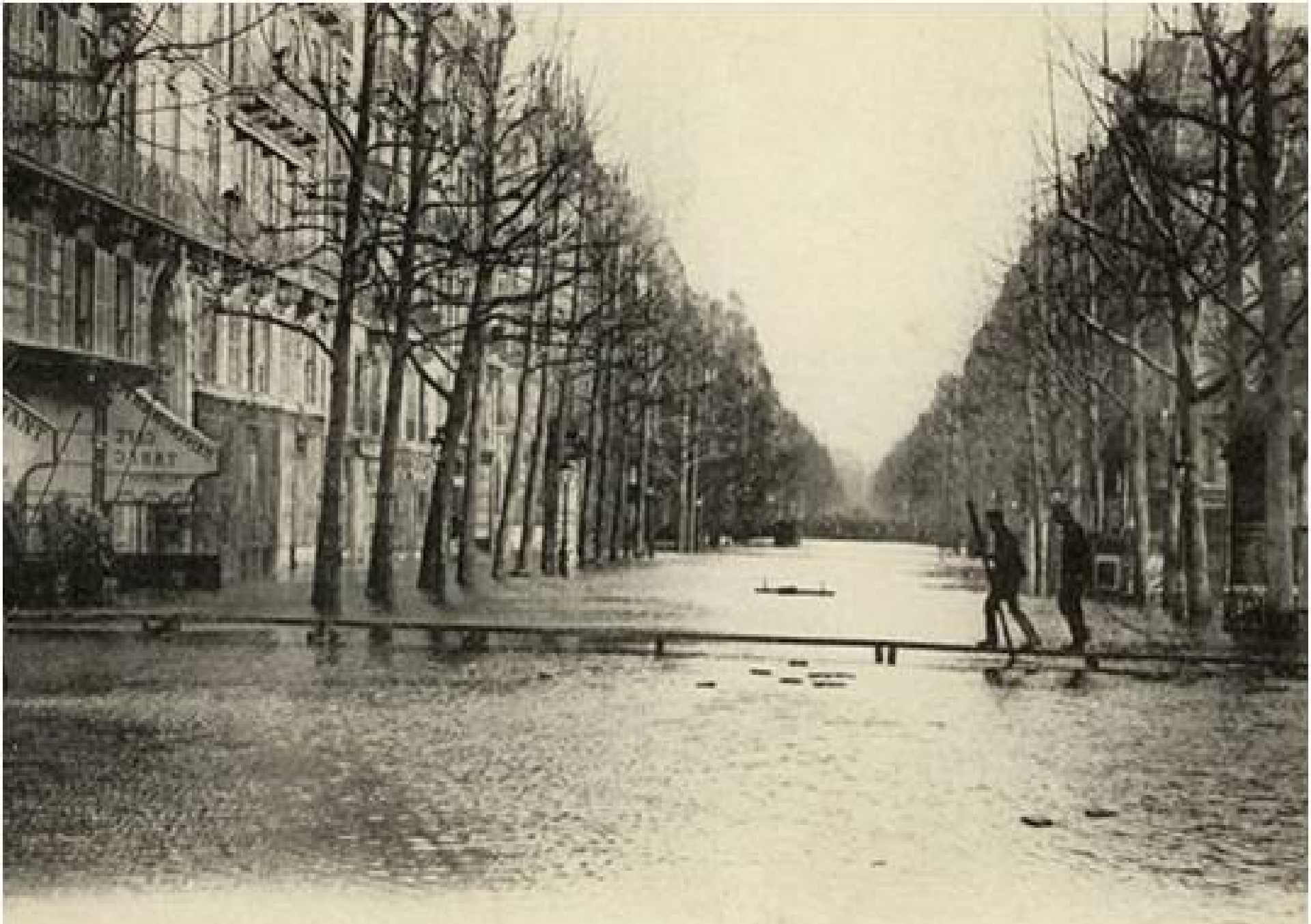
80 INONDATIONS DE PARIS (Janvier 1910). — Passerelle Boulevard Haussmann.