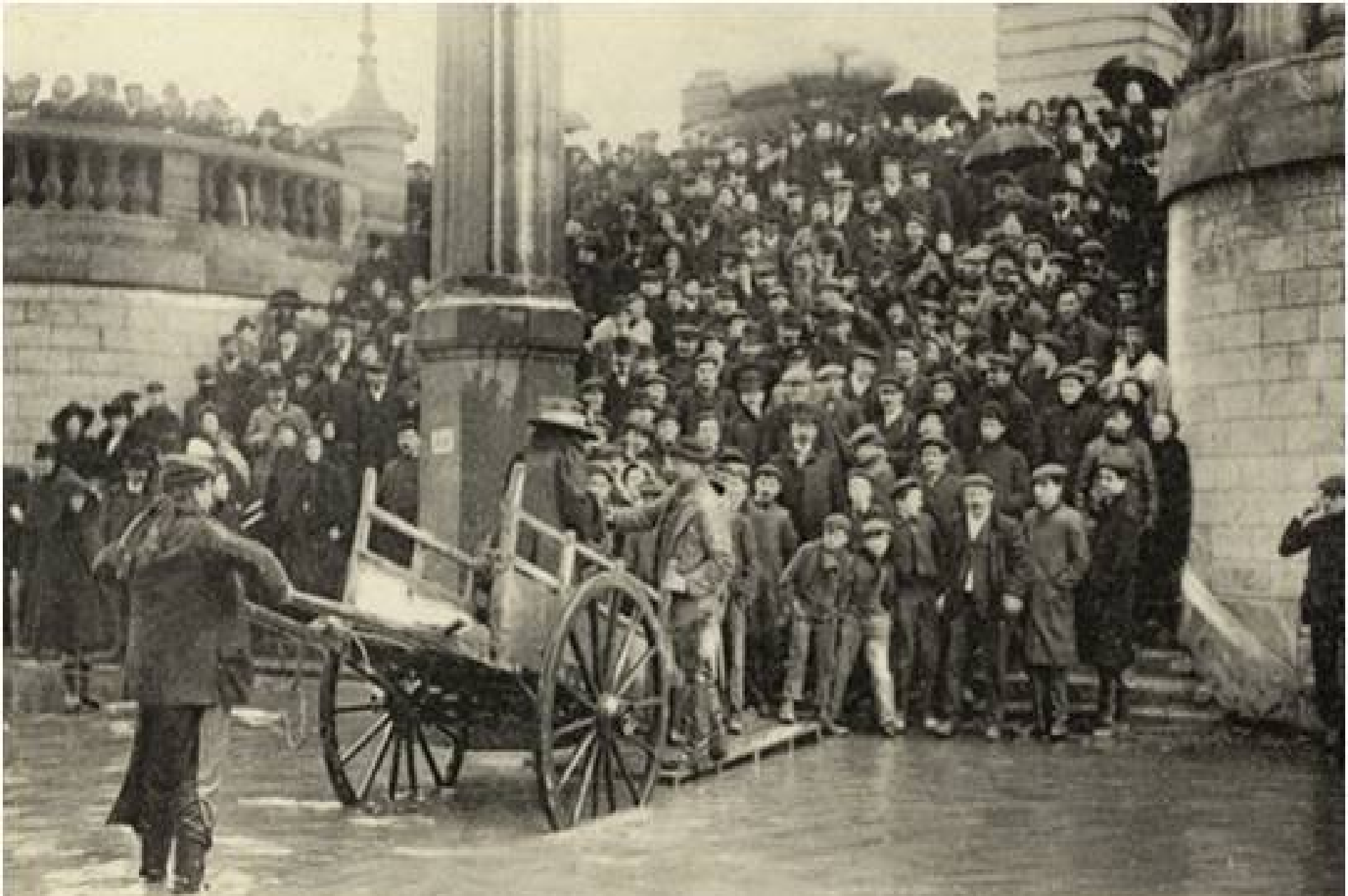
La Crue de la Seine (Janvier 1910)