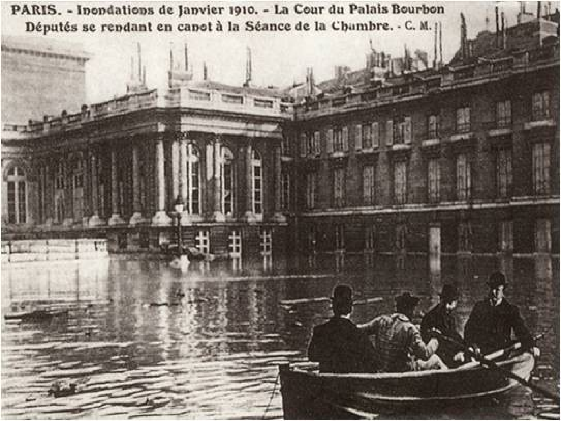
PARIS. - Inondations de Janvier 1910. - La Cour du Palais Bourbon Députés se rendant en canot à la Séance de la Chambre. - G. M.