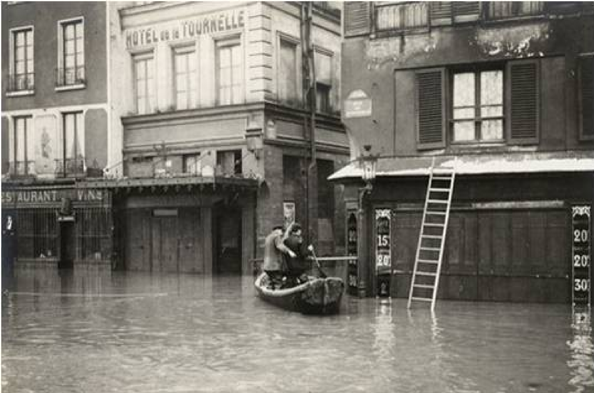
PARIS, — LA GRANDE CRUE DE LA SEINE (Janvier 1910) Inondation du Quai de la Tournelle.