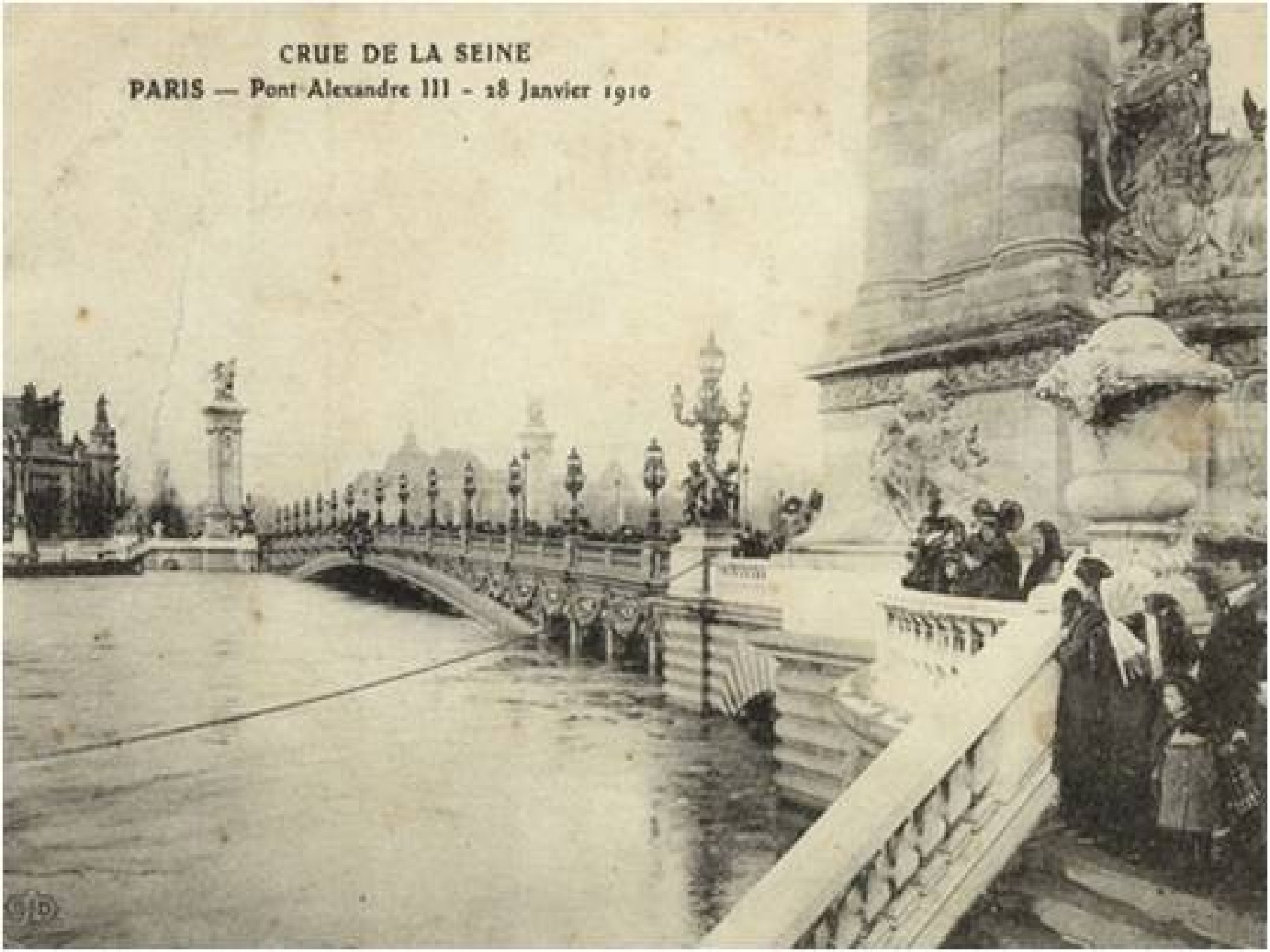
CRUE DE LA SEINE PARIS — Pont Alexandre III - 28 Janvier 1910