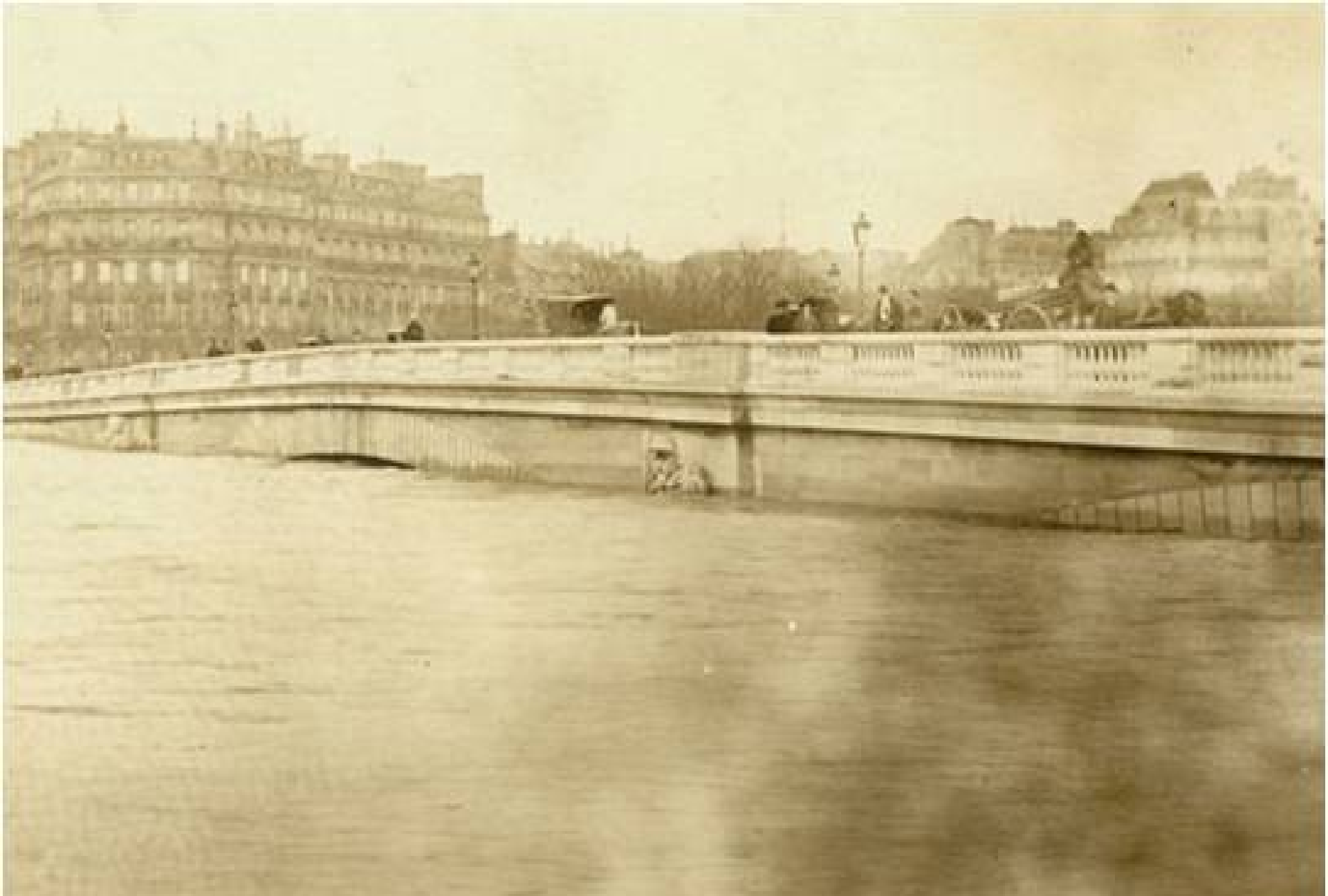
"PARIS INONDÉ" Pont de l'Alma.