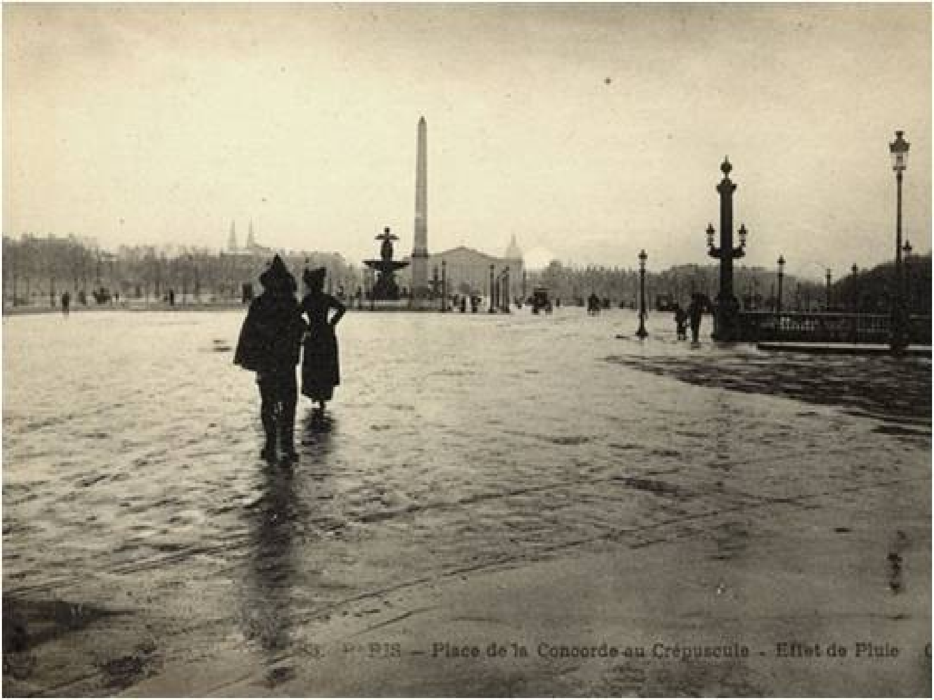
PARIS — Place de la Concorde au Crépuscule - Effet de Pluie