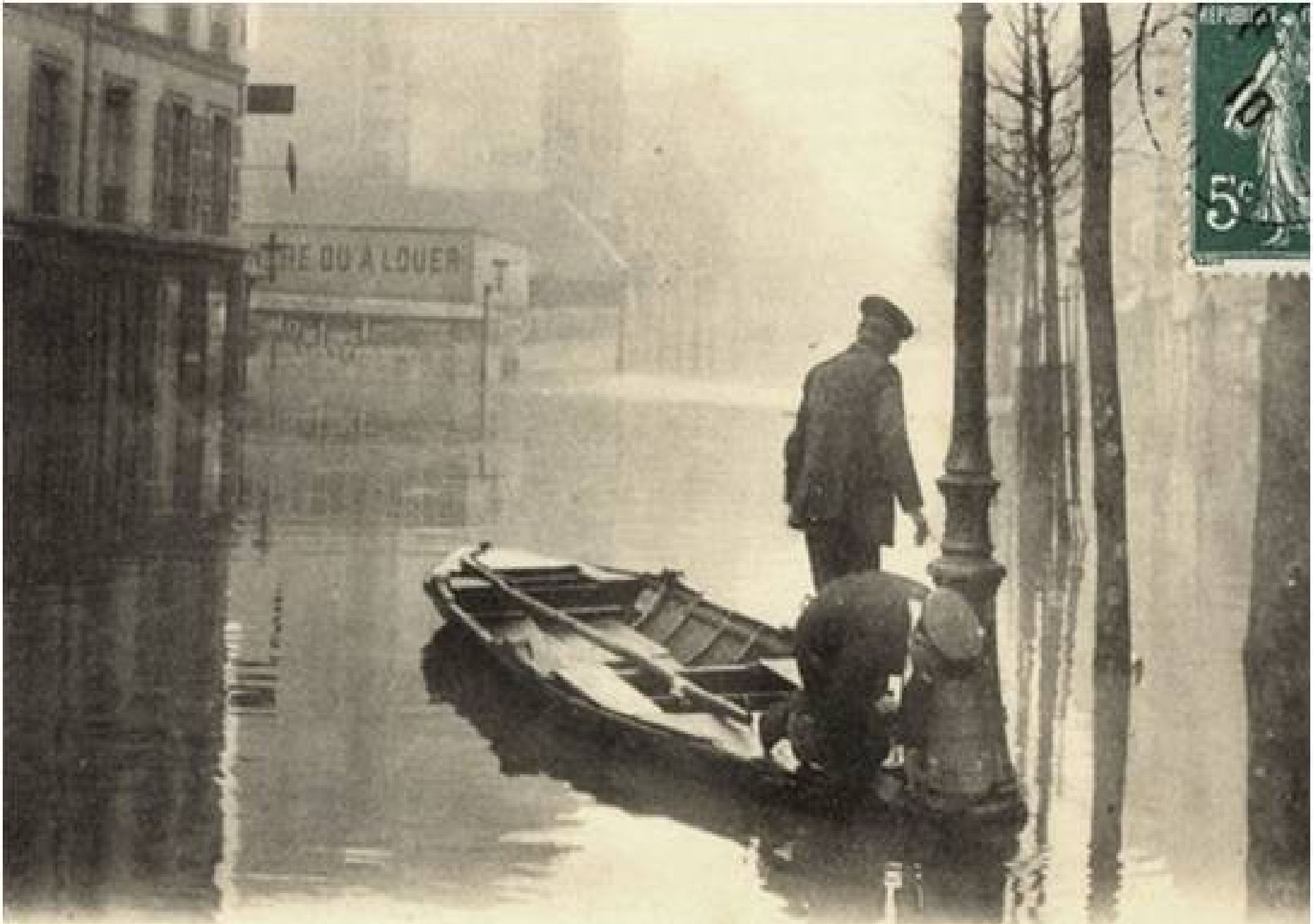
251 INONDATIONS DE PARIS (Janvier 1910). - Boulevard Diderot. - I.L.