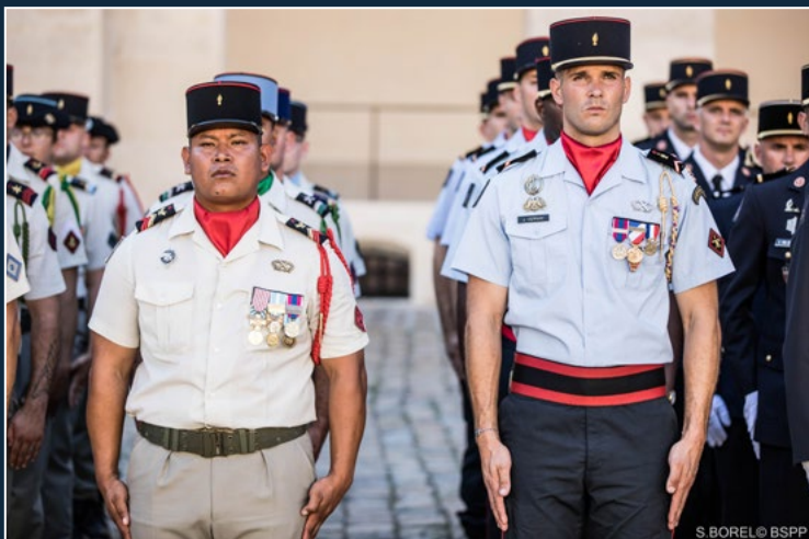
Cérémonie aux Invalides