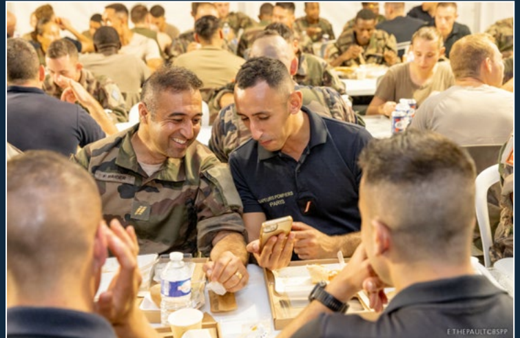
Moment de camaraderie