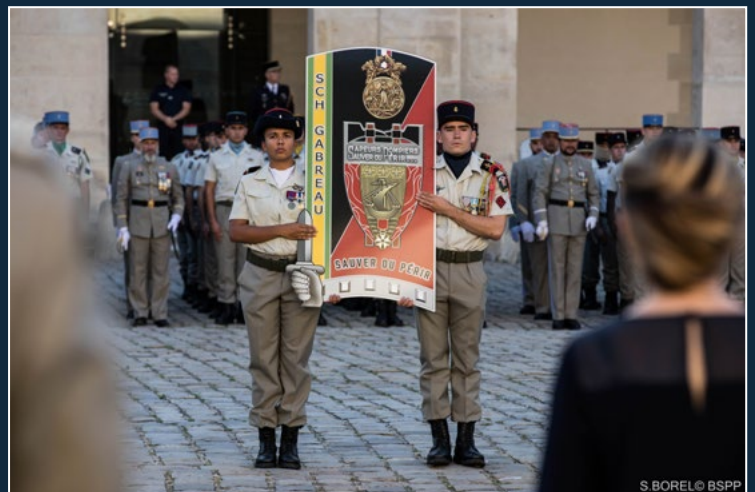
Insigne de la promotion