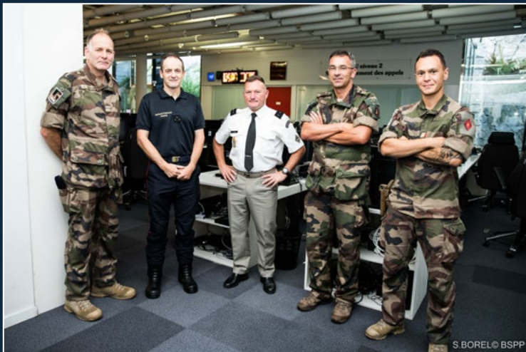
Visite du centre opérationnel