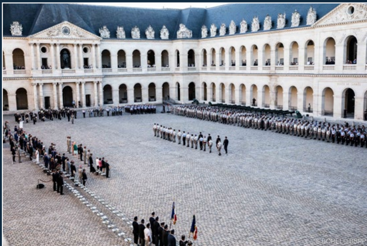
Cour d'honneur des Invalides