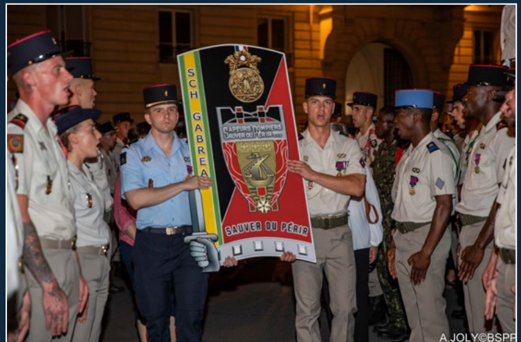
Remise du totem à la 5 e compagnie d'incendie et de secours