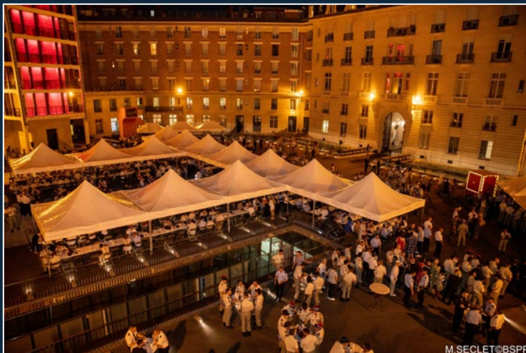
Buffet à l'état-major de la Brigade