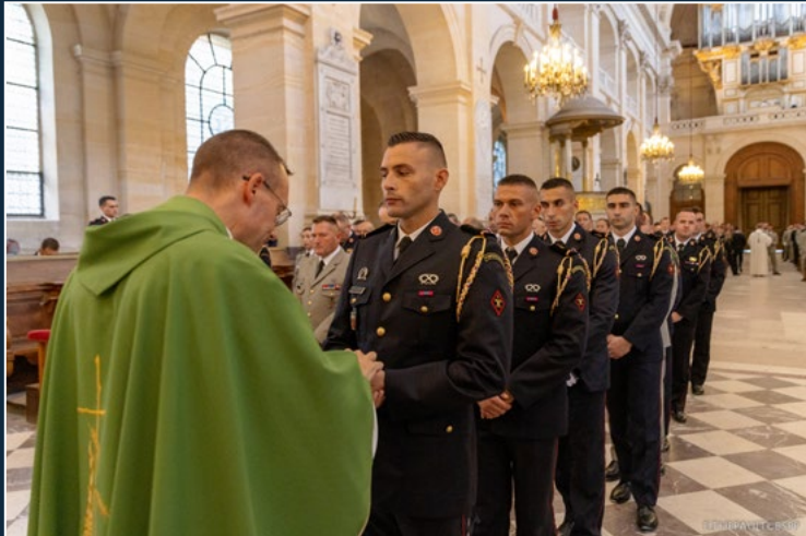
Messe aux Invalides

Les 6 et 7 septembre 2023 ont été marqués par le baptême conjoint des promotions de sous-officiers de la Brigade et de l'École nationale des sous-officiers d'active (ENSOA) de Saint-Maixent-l'École. Retour en images sur les moments forts de cet évènement historique, parmi lesquels une messe donnée en la cathédrale Saint-Louis des Invalides et la cérémonie de parrainage dans la cour d'honneur des Invalides, ainsi que de nombreux moments de partage, de cohésion et de fraternité.