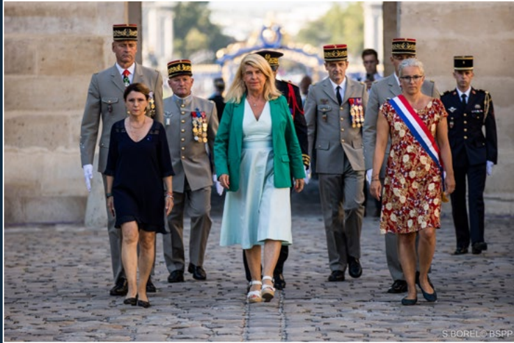
Arrivée des autorités