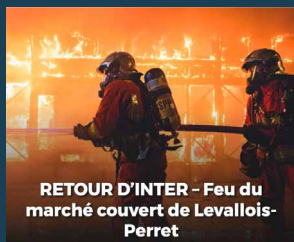
RETOUR D'INTER - Feu du marché couvert de Levallois-Perret