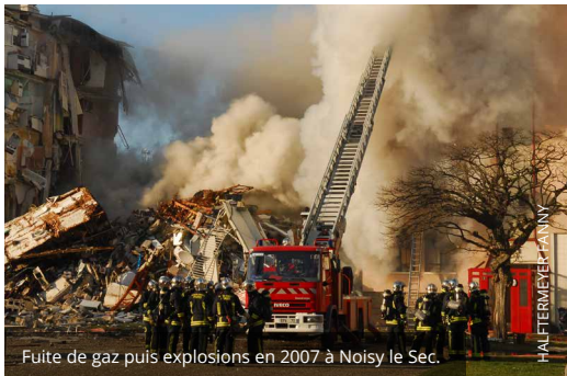
Fuite de gaz puis explosions en 2007 à Noisy le Sec.

Revivre douze ans plus tard une intervention pour explosion de gaz avec les acteurs de l'époque, mais avec les moyens d'aujourd'hui. Tel est l'objet de l'étude tactique sur le terrain (ETT) qui aura lieu le 23 janvier 2020 au CS Bondy. Cet exercice vise à approfondir le raisonnement tactique des officiers et chefs de garde à travers l'étude d'une opération majeure. Il permet également de développer la connaissance de l'histoire des opérations importantes de la BSPP et plus particulièrement celle du GIS1.