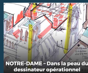
NOTRE-DAME - Dans la peau du dessinateur opérationnel